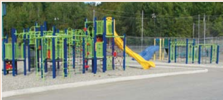
Nouvel aménagement de la cour de l'école De Léry-Monseigneur-De Laval

Le ministère de l'Éducation, du Loisir et du Sport a octroyé durant l'année 2005-2006 une somme additionnelle de 1 550 729 $ permettant la réalisation de 19 projets d'investissement. Cette annonce a été faite dans le cadre d'une mesure d'aide financière effective pour les 3 prochaines années et visant prioritairement l'enveloppe architecturale des bâtiments : toitures, fenêtres et revêtements extérieurs.