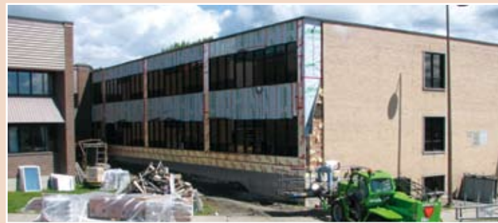
Polyvalente Saint-François: Réfection des fenêtres