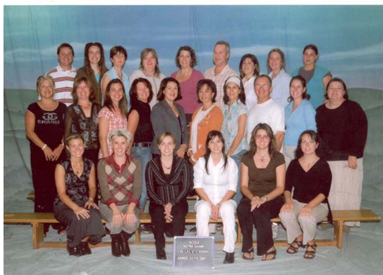
Personnel de l'école 2006-2007