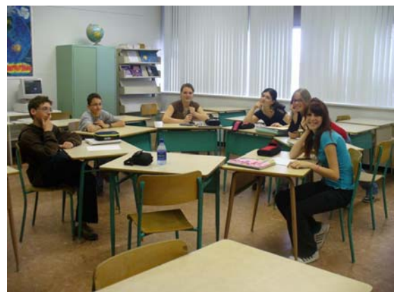
Le conseil d'élèves du secondaire.