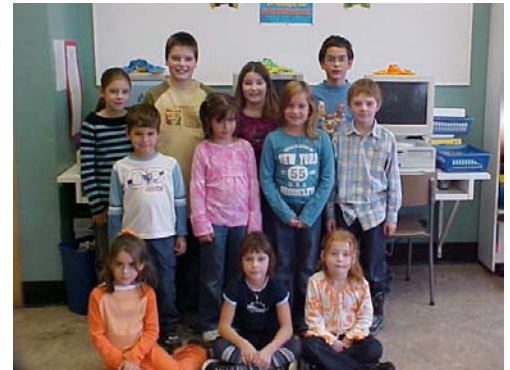
Le conseil d'élèves du primaire